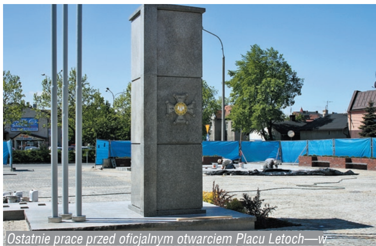
Ostatnie prace przed oficjalnym otwarciem Placu Letochów—w.

Znajdujący się tam pomnik Powstańców Śląskich został odnowiony i dodatkowo zbudowano fontannę. Powierzchnia placu została wyłożona kostką brukową i płytami granitowymi. Na placu znajdują się ławki i zieleń ozdobna, a cały teren jest oświetlony i monitorowany.