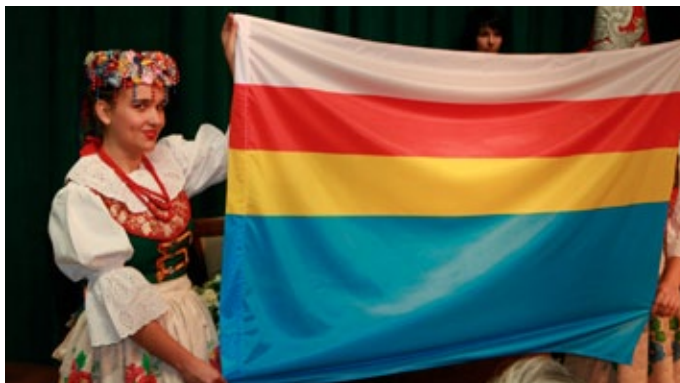
Miejskie insygnia stanowią własność gminy

Natomiast chorągiew jest uroczystą, dwustronną odmianą flagi. Bławat chorągwi składa się z czterech poziomych stref: srebrnej, czerwonej, złotej i błękitnej oraz umieszczonego w jej symetrycznym środku herbu. Lewa strona chorągwi jest lustrzanym odbiciem strony prawej bławatu. Bławat jest przymocowany do drzewca. Zgodnie z przyjętą uchwałą w sprawie zasad korzystania z insygniów miejskich, prawo