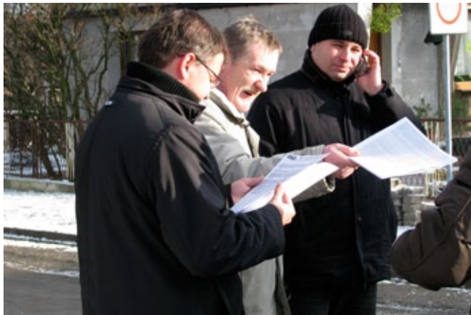
Oficjalne zakończenie robót na ulicy 27 Stycznia

P od koniec grudnia zakończono przebudowę sieci wodociągowej w ulicy 27 Stycznia w Radzionkowie. Roboty, trwające od sierpnia ubiegłego roku, wykonywane były na zlecenie gminy przez Zakład Gospodarki Komunalnej. Natomiast nawierzchnie dróg zostały odtworzone przez miasto.