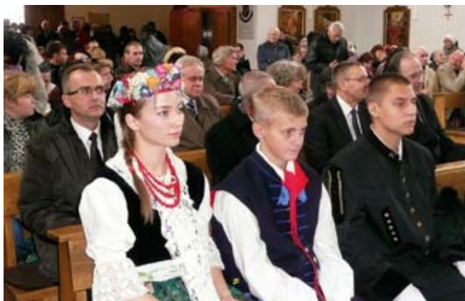
Uroczystości rozpoczęła Msza Św., w której wzięła udział delegacja naszego regionu.