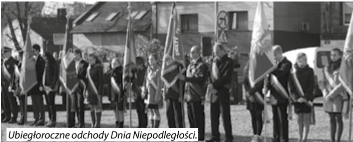
Ubiegłoroczne odchody Dnia Niepodległości.

Sportową rywalizacją rozpoczną się w Radzionkowie tegoroczne obchody kolejnej rocznicy odzyskania przez Polskę niepodległości. 8 i 9 listopada na hali sportowej MOSiR rozegrane zostaną rozgrywki czwartego Turnieju Piłki Nożnej Halowej. Dodatkowo 9 listopada w godzinach przedpołudniowych w Centrum Kultury „Karolinka” szachiści zmierzą się w XII Grand Prix Radzionkowa w szachach.