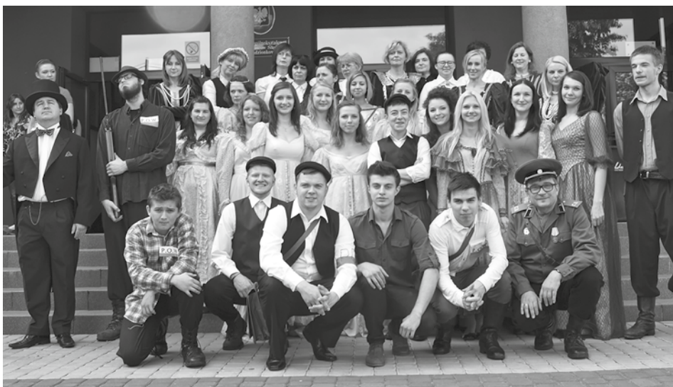
Tak było w ubiegłym roku.