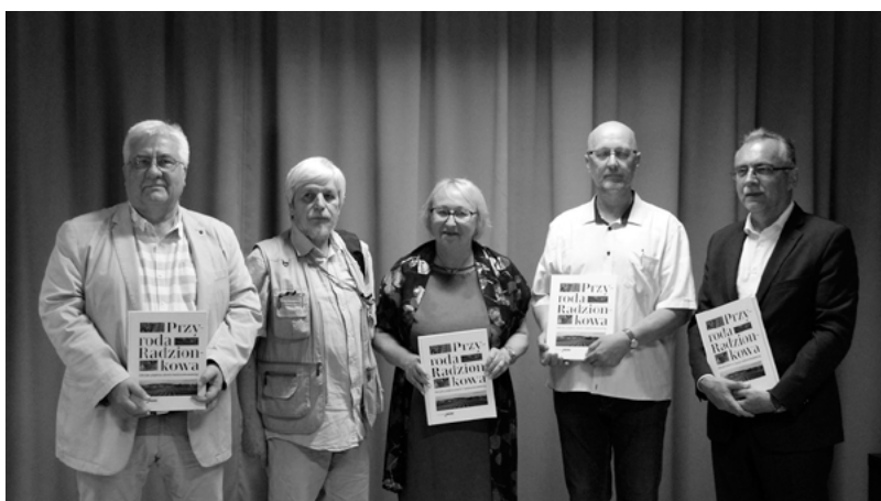
Autorzy książki wraz z burmistrzem.

Na rynku wydawniczym ukazała się książka „Przyroda Radzionkowa. Ukryte piękno ziemi radzionkowskiej”. To pierwsze takie opracowanie o mieście. Publikację przygotowali miłośnicy natury związani ze Stowarzyszeniem Przyjaciół i Sympatyków Ekologii „Zielona Ziemia”.