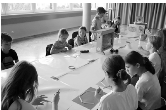
Warsztaty tworzenia świec z wosku.