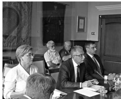
Burmistrz otrzymał absolutorium.