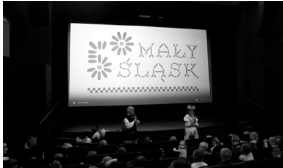
Dzieci poznały śląskie tradycje.

W Centrum Kultury „Karolinka” 7 lipca br. odbyły się warsztaty edukacyjne dla przedszkolaków. Zajęcia zostały zrealizowane w ramach projektu „Edukacyjne spotkania z kulturą ludową”, dofinansowanego ze środków budżetu Województwa Śląskiego.