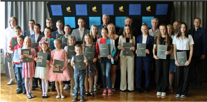
Najlepsi sportowcy nagrodzeni.