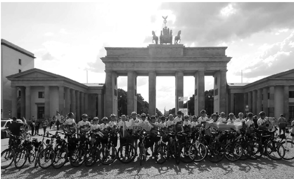
Uczestnicy pielgrzymki rowerowej.

Uczestnicy XI Gnieźnieńskiej Pielgrzymki Rowerowej Magdeburg – Gniezno – Radzionków serdecznie dziękują wszystkim darczyńcom i podmiotom wspierającym pielgrzymów.