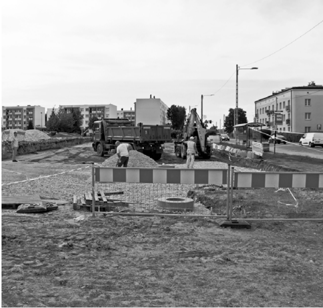
Przy Eko-Rynku powstanie 50 miejsc parkingowych.

Zakończyły się prace związane z budową jezdni na ul. M. Dąbrowskiej. Była to jedna z najważniejszych miejskich inwestycji ostatnich lat.