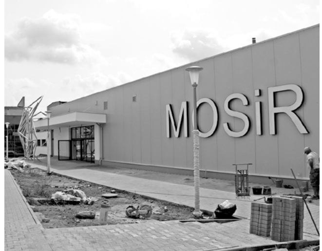
Pływalnia zostanie otwarta w tym roku.

Jeszcze w tym roku otwarta zostanie kryta pływalnia. Aktualnie trwają intensywne prace wewnątrz budynku związane z wykonaniem posadzek. Montowana jest też stolarka drzwiowa. Sukcesywnie prowadzone są prace elektryczne wraz z montażem osprzętu, a także tynkarskie i malarskie oraz związane z wypłyceniem toru.