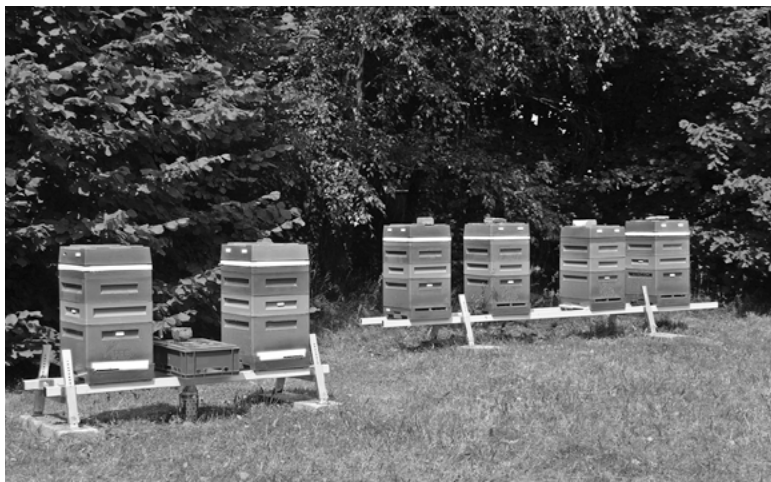
Na terenie Ciepłowni stanęło sześć uli.

Przedsiębiorstwo Energetyki Ciepłej Sp. z o.o. w Bytomiu skutecznie walczy z niską emisją, rozbudowując sieć ciepłowniczą w Bytomiu i Radzionkowie, a dodatkowo podejmuje inne proekologiczne działania. W ramach akcji „Ciepło jak w ulu” na terenie Ciepłowni Radzionków postawiło sześć uli.