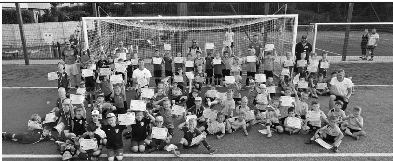
W turnieju wystąpiły dzieci z roczników 2015 i 2016.