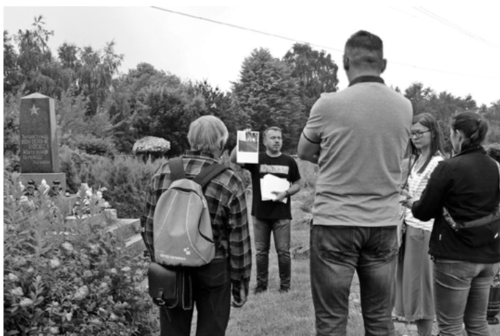
W ramach święta GZM w Radzionkowie odbyły się dwie wycieczki.

Zrealizowano z udziałem środków finansowych z budżetu Górnośląsko-Zagłębiowskiej Metropolii.