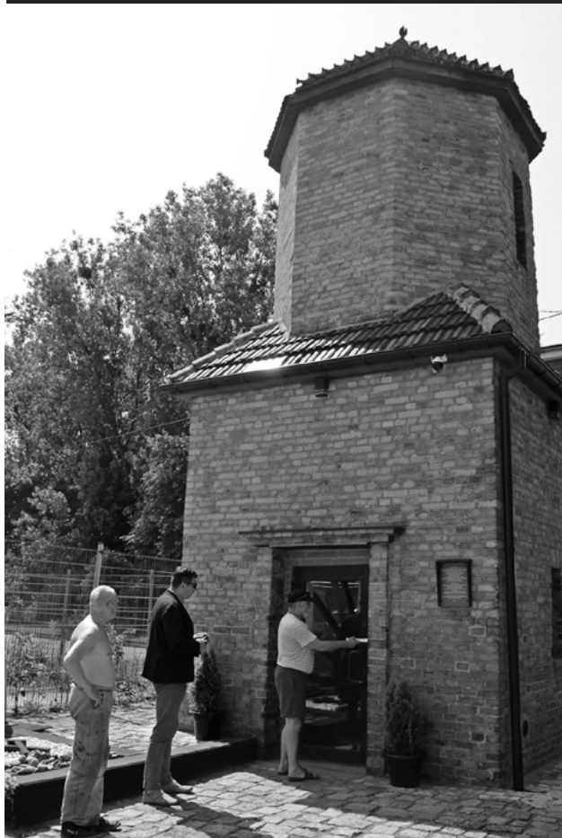
Kaplica św. Barbary.