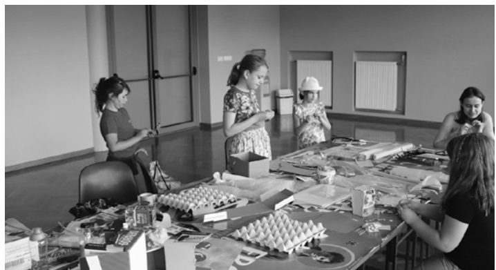
Dzieci dały upust swej kreatywności.