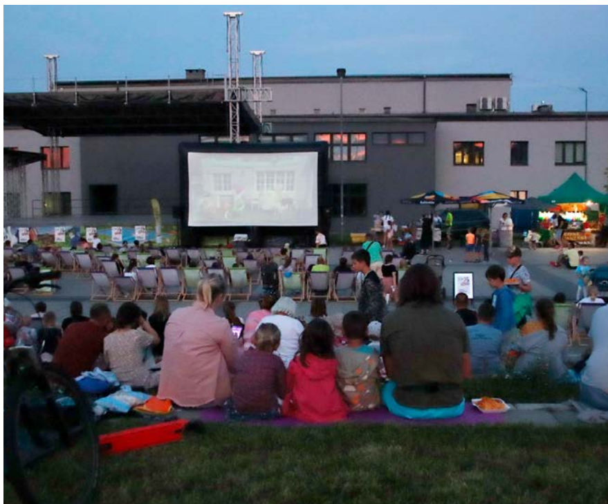
Familijne Kino Plenerowe.

W czasie tegorocznych wakacji Centrum Kultury „Karolinka” realizuje projekt „Litery Kultury”.