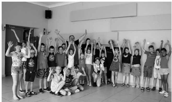
Prowadzący i uczestnicy zajęć kulinarnych.

Wszystkie Latolinkowe aktywności cieszyły się dużą popularnością – zarówno dobrze wszystkim znane formaty (bajkowe seanse w Kinie „Karolinka”, gry planszowe czy warsztaty krawieckie i kulinarne), ale i nowości (warsztaty druku 3D, kreatywno-ogrodnicze i tworzenia świec z wosku). Podczas warsztatów każdy z uczestników nie tylko dowiadywał się czegoś nowego i nabywał nowe umiejętności, ale przy okazji dobrze się bawił i dawał pole do popisu swojej twórczości i kreatywności. Do zakończenia wakacji zostało jeszcze kilkanaście dni – zachęcamy by na bieżąco śledzić naszą stronę internetową i Facebook’a – tam zawsze znajdziecie najświeższe informacje odnośnie zaplanowanych w „Karolince” wydarzeń.