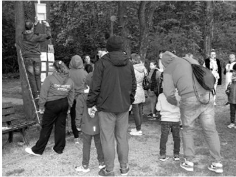
Akcja wieszania budek dla nietoperzy.

W piątek 12 maja na Księżej Górze odbyła się otwarta impreza przyrodniczo-ekologiczna „Noc Nietoperzy”. To był jeden z pierwszych tegorocznych ciepłych wieczorów więc frekwencja dopisała. Równie aktywne okazały się nietoperze, których w naszym Ogrodzie nie brakuje.