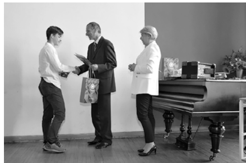
Wręczenie nagród laureatom konkursów.

26 kwietnia – jak co roku mniej więcej o tej porze – gościliśmy uczniów klas ósmych z okolicznych szkół podstawowych. Nasze liceum podczas swojego dnia otwartego cieszyło się sporym zainteresowaniem – odwiedzili nas przyszli absolwenci nie tylko szkół z Radzionkowa, ale i z Bytomia, Piekar Śląskich, Tarnowskich Gór, Świerklańca, Pniowca, Sowic, Miasteczka Śląskiego, a nawet z Pyskovic.