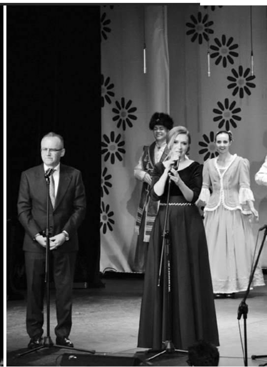
Występ grup dziecięcych i młodzieżowych „Małego Śląska”.