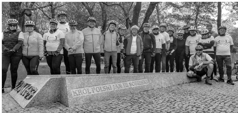
Uczestnicy wyprawy rowerowej.

Od 29 kwietnia do 3 maja br. pasjonaci turystyki rowerowej ze Stowarzyszenia „Cidry na Kole” zorganizowali „Rowerową Raję ze Śląska, trasą króla Jana III Sobieskiego w 340 rocznicę Odsieczy Wiedeńskiej”.