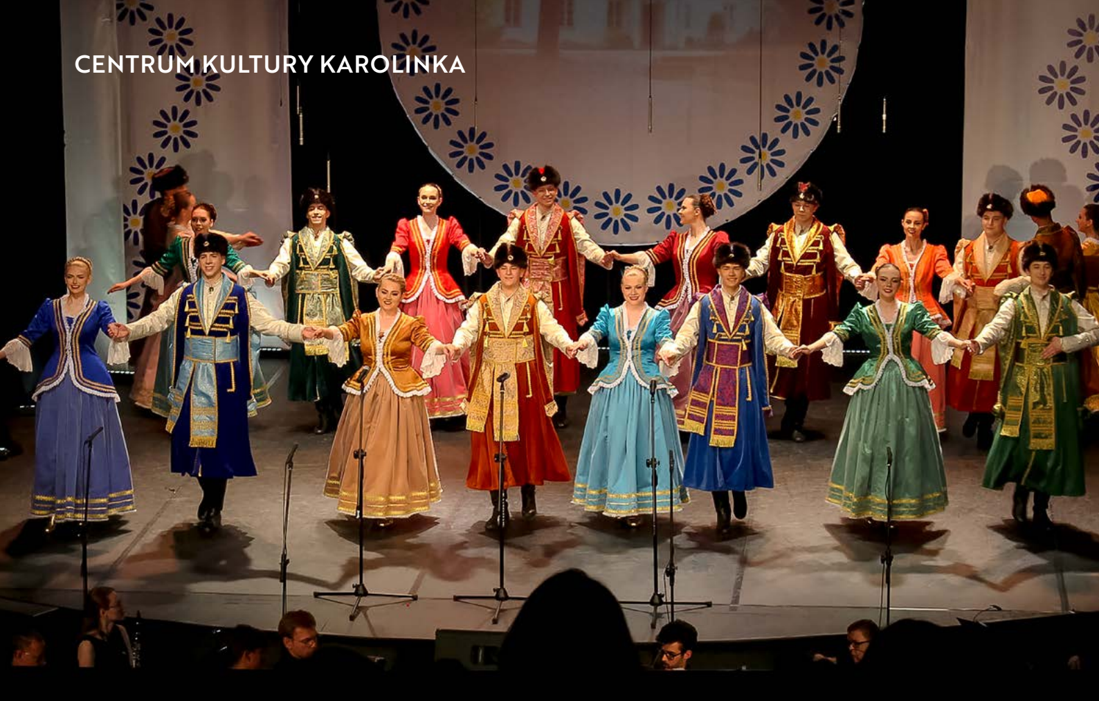
Koncert galowy „Małego Śląska”.