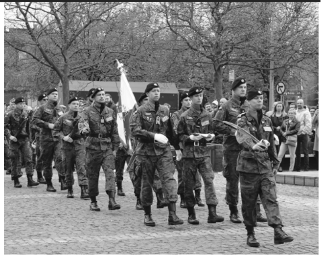
Uroczystości na Placu Letochów.

Uroczyscie w mieście było także 2 maja – z okazji Dnia Flagi RP. Członkowie 17. Radzionkowskiej Drużyny Piechoty Zmechanizowanej, wspierani przez Radzionkowski Szczep Drużyn Har-