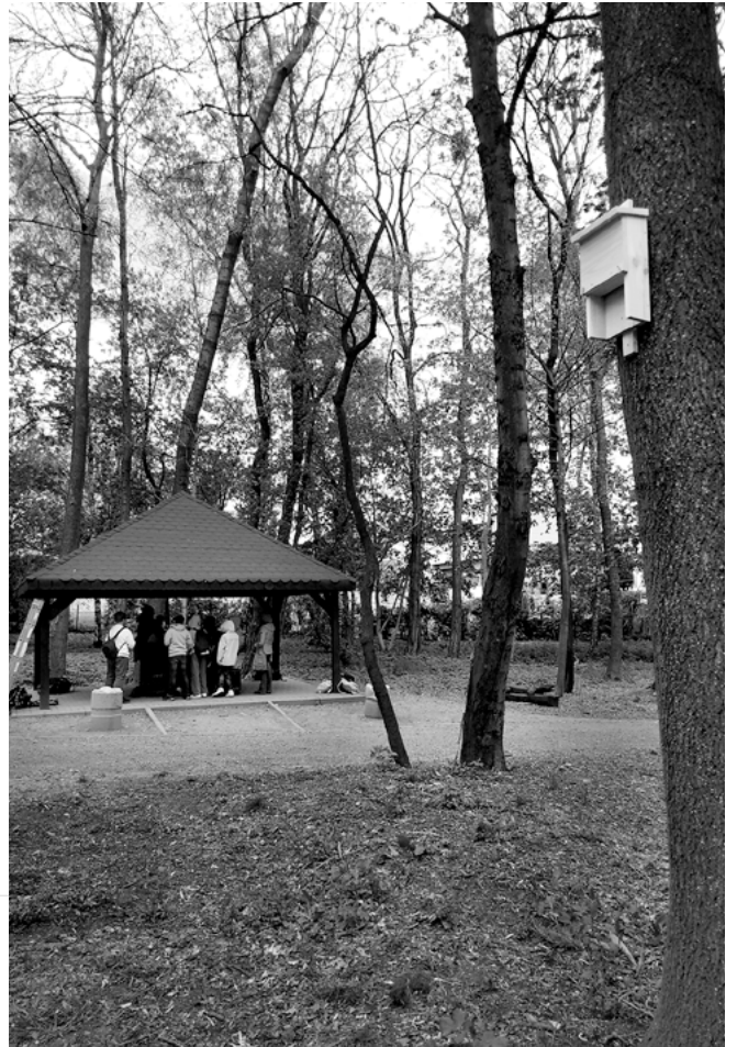
Terenowe warsztaty przyrodnicze.

Oczywiście budowa siedlisk zastępczych jest istotnym czynnikiem ochrony nietoperzy, ale nie mniej ważna jest edukacja przyrodnicza w zakresie roli tych zwierząt w ekosystemach oraz w kwestii budzenia świadomości ekologicznej wśród społeczeństwa. Tym aspektem najlepiej zajmują się pasjonaci ze Śląskiego Ogrodu Botanicznego w Radzionkowie, którzy 8 maja 2023 r. w danielce parku przeprowadzili terenowe warsztaty przyrodnicze dla uczniów szkół podstawowych, natomiast 12 maja 2023 r. w Regionalnej Stacji Edukacji Ekologicznej i na terenie samego Ogrodu zorganizowali „Noc nietoperzy”. Wśród wielu atrakcji znalazły się: rodzinna gra terenowa, warsztaty plastyczne dla dzieci, warsztaty mikroskopowe, wykłady specjalistów oraz wyjście w teren na ultradźwiękowy na-