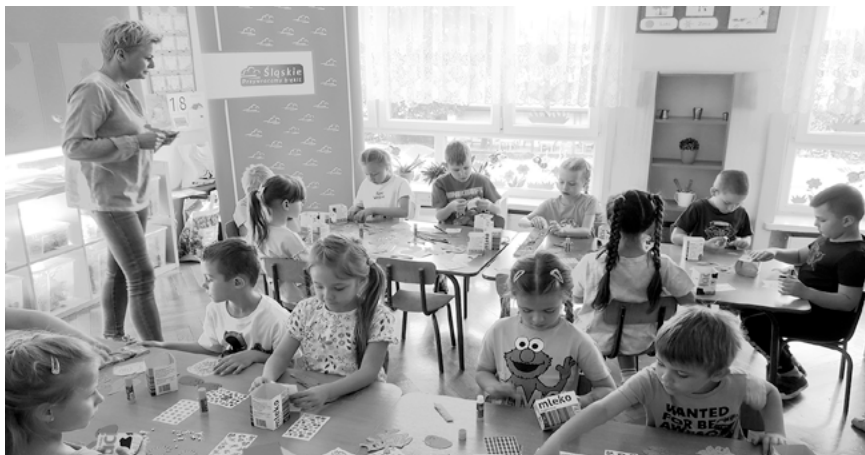
Spotkanie z ekodoradcą.

Ekodoradca z Urzędu Miasta Radzionków gościł we wtorek, 23 maja w grupie Jagódek z Przedszkola nr 3 z warsztatami edukacyjnymi. Wiodącym tematem zajęć było życie na łące pełnej kwiatów.