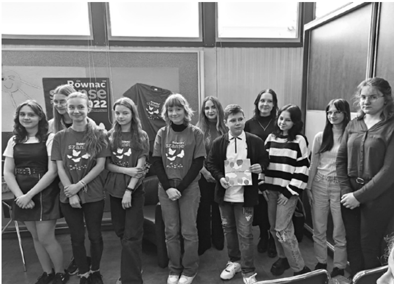
Młodzi autorzy książki „Zwierzaki z naszej paki”.

Kwiecień to miesiąc, w którym zakończyły się półroczne zmagania z zadaniem „Kierunek KSIĄŻKA”. Był to projekt realizowany w ramach programu Polsko-Amerykańskiej Fundacji Wolności „Równać szanse 2022”.