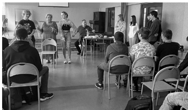
Wspólnie z terapeutami uczniowie rozmawiali o negatywnych skutkach spożywania alkoholu.

Celem spotkań było przede wszystkim przekształcenie nieprawidłowych przekonań panujących wśród młodzieży na temat używek oraz pogłębienie wiedzy na temat realnych konsekwencji picia i używania innych środków zmieniających świadomość. W warsztatach wzięło udział 101 uczniów z klas ósmych.