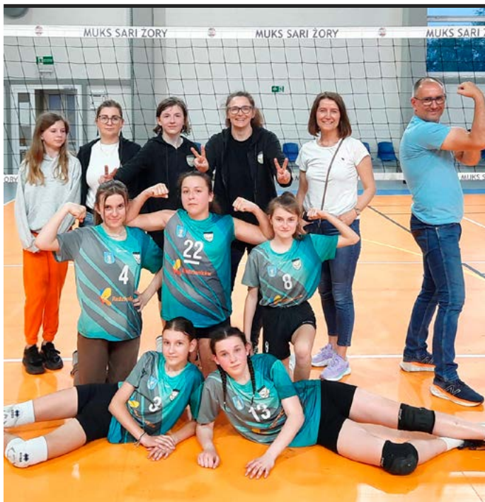
Młodzi zawodnicy „Sokoła” mogą poszczycić się już sporymi osiągnięciami sportowymi.