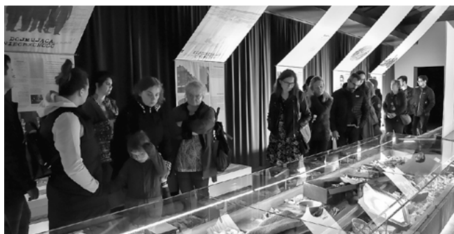
Nocne zwiedzanie ekspozycji stałej.

Centrum Dokumentacji Deportacji Górnolązaków do ZSRR w 1945 w ramach akcji Noc Muzeów 2023 przygotowało dla odwiedzających wiele atrakcji.