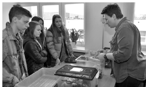
Prezentacja pracowni biologicznej.