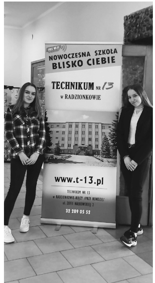
O atutach Trzynastki opowiadali odwiedzającym uczniowie szkoły.

18 kwietnia w naszej Trzynastce odbyło się jedno z ważniejszych wydarzeń w roku – Dzień Otwarty. Czekali na niego zarówno obecni uczniowie szkoły, chcący poznać nowych kolegów, jak i licznie przybyła w nasze mury młodzież.