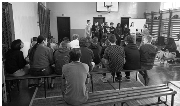
Uczniowie w trakcie zajęć.

Na zlecenie Urzędu Miasta Radzionków, 24 kwietnia w Szkołach Podstawowych nr 2 i nr 4 odbyły się warsztaty profilaktyczne poruszające problematykę alkoholizmu i narkomanii.