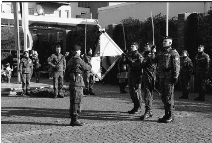
Obchody Dnia Niepodległości odbyły się tradycyjnie na Placu Letochów.