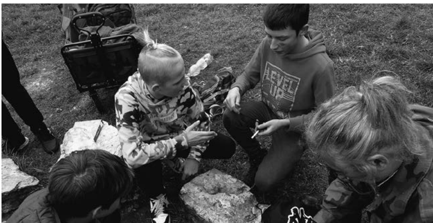
Uczniowie sadzą rośliny.

Powyższe liczby dotyczą tylko edukacji zorganizowanej, ale Śląski Ogród Botaniczny umożliwia również skuteczną edukację przyrodniczą indywidualnym odwiedzającym. Wychodząc naprzeciw wszystkim zainteresowanym, na terenie Ogródu ustawiono tablice edukacyjne, tabliczki z nazwami gatunków oraz różnego rodzaju pomoce dydaktyczne. Aby uatrakcyjnić zwiedzanie i pomóc w zdobywaniu wiedzy w trudnych czasach pandemii, gdy ograniczona jest możliwość bezpośredniego kontaktu z przewodnikiem, w Ogróde powstał ogólnodostępny quest przyrodniczy. Szacunkowo skorzystało już z niego około 1000 graczy. Podsumowując, mijający rok pełen obustrzeń, niepewności i przeciwności, był czasem kreatywności i otwarcia na zmiany, nauczył pokory, kompromisów i dystansu do wielu spraw. Jaki będzie kolejny? Warto wierzyć, że lepszy. Jak zawsze.