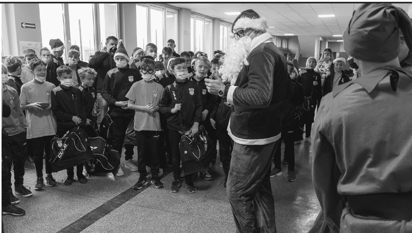
Mikołaj nie tylko przyniósł prezenty, ale przyprowadził też specjalnych gości.