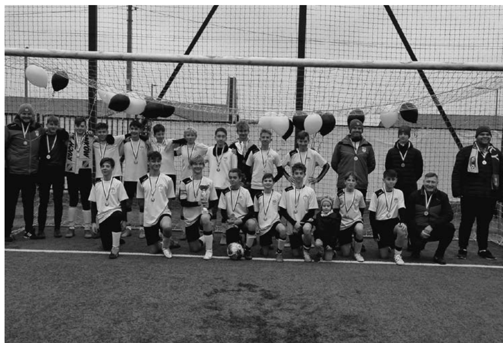
Zespół trampkarzy starszych awansował do II ligi wojewódzkiej.