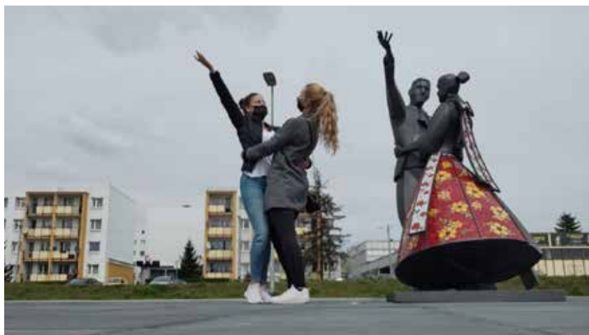
Uczestniczki gry miejskiej