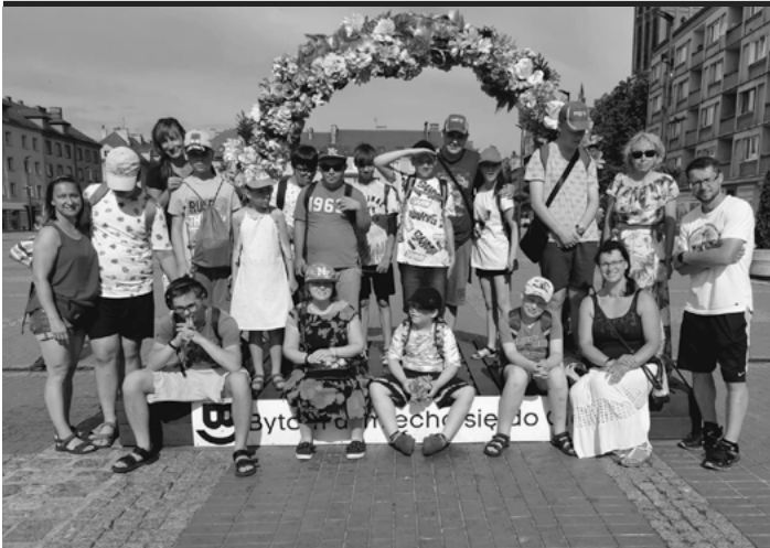
Uczestnicy półkolonii na rynku w Bytomiu.