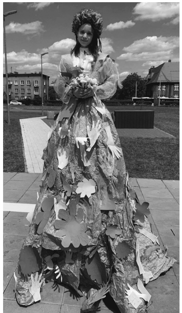
Happening „Ruchome rzeźby”.