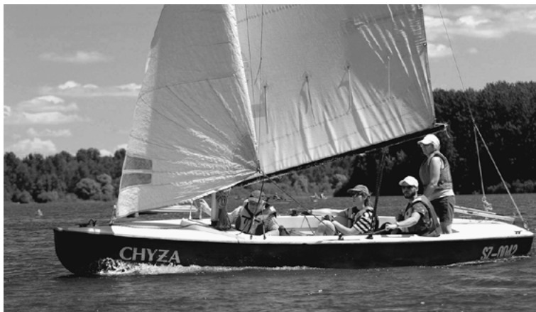
Wróciły mistrzostwa Radzionkowa w żeglarstwie.

Kolejne zawody, za którymi tak bardzo tęskniliśmy. Po przerwie spowodowanej pandemią, wróciły Mistrzostwa Radzionkowa w Żeglarstwie. Tegoroczna, XVIII już edycja, odbyła się 11 czerwca, jak zwykle na zalewie w Przeczycach.