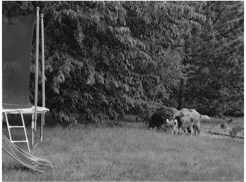
Dziki coraz częściej widywane są w przestrzeni miejskiej.

Przyczyn takiego stanu rzeczy jest wiele, a najważniejszą jest łatwość zdobycia pożywienia, które zwierzęta znajdują w odpadach wyrzucanych przez ludzi lub na terenie przydomowych upraw ogrodniczych i sadowniczych. Dzikom „nie przeszkadza” już bliska obecność człowieka, przyzwyczały się do tego stopnia, że stają się tzw. gatunkiem synantropijnym, czyli żyjącym w środowisku znacznie przekształconym przez ludzi, jakże odmiennym od siedlisk naturalnych. Oczywiście nie znaczy to, że dziki możemy traktować jak zwierzęta towarzyskie czy udomowione. Przy kontakcie z nimi zawsze należy zachować ostrożność, jednakże obecnie dzik nie jest już tak dziki jak wtedy, gdy Jan Brzechwa pisał swój słynny wiersz – „Zoo”.