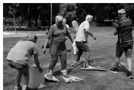
Zabawy i konkursy w ramach pikniku.