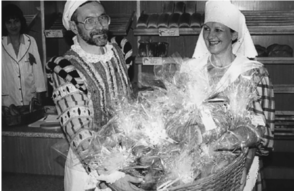
Piekarnia w Dobrym Mieście działa od 1945 roku.

Mieszkańcom naszego miasta bliskie są tradycje piekarnicze. Liczne radzionkowskie piekarnie z pokolenia na pokolenie wypiekają pieczywo, które zna każdy mieszkaniec. Podobnie ma się historia piekarni „Złoty Róg” z Dobrego Miasta – naszego wieloletniego miasta partnerskiego. Zakład znalazł się w bardzo trudnej sytuacji i potrzebuje pomocy.