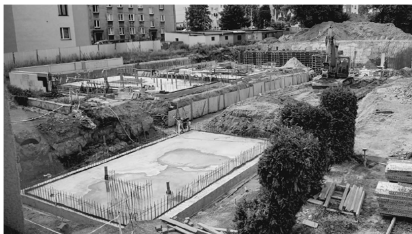
Prace ziemne na budowie krytej pływalni.

Trwają prace związane z budową krytej pływalni. Na ukończeniu są roboty ziemne, kontynuowane są też prace z wykonaniem fundamentów oraz konstrukcji żelbetowych.