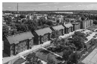
Zrewitalizowane osiedle Hugona.

Radzionkowskie Osiedle Hugona zostało zgłoszone do plebiscytu publiczności na Najpiękniejszą Przestrzeń Publiczną Województwa Śląskiego.