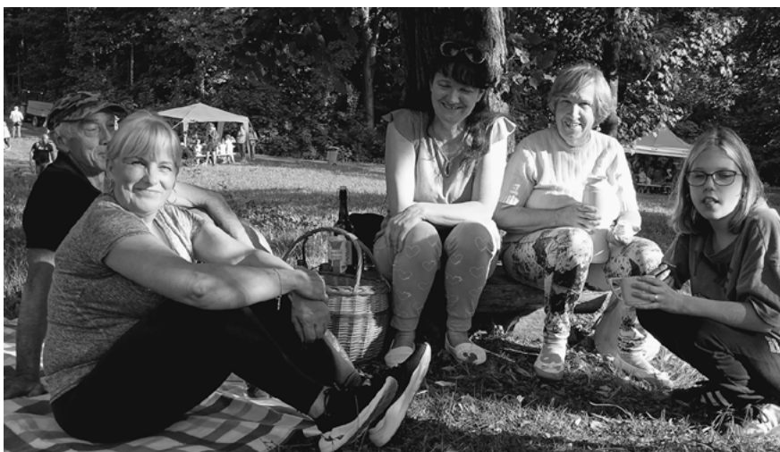
Nie zabraknie ciekawych warsztatów i niezwykłych pokazów.

Śląski Ogród Botaniczny zaprasza na piknik z okazji zakończenia wakacji, który odbędzie się w środę 31 sierpnia . Będzie to czas na być może ostatni wakacyjny relaks oraz złapanie oddechu przed nowymi wrześniowymi obowiązkami.