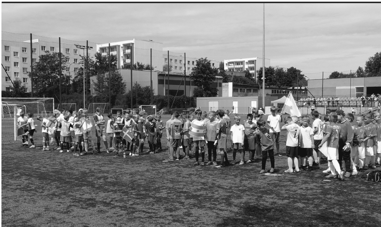
Uczestnicy Powiatowego Mini-Mundialu 2022.