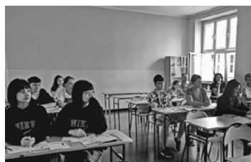
Zajęcia potrwają do końca wakacji.

Trwa kurs języka polskiego dla uchodźców z Ukrainy, przebywających w naszym mieście. Zajęcia, organizowane przez radzionkowski magistrat, zaczęły się w lipcu i potrwają do końca wakacji. Bierze w nich udział około 20 osób.