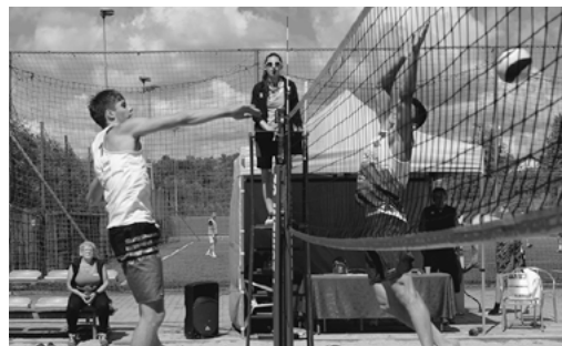
Pogoda dopisała, a rywalizacja była zacięta.

Prażące słońce, bezchmurne niebo, wysoka temperatura i wakacje. Trudno sobie wyobrazić lepsze warunki do rozegrania VII Mistrzostw Śląska w Siatkówce Piłkowej Mikstów. Zawodnicy do rywalizacji stanęli 17 lipca, na obiektach Księżej Góry.