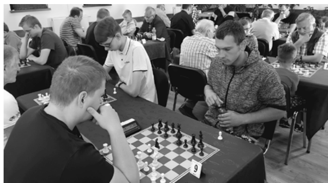
W rozgrywkach wzięło udział 24 uczestników.