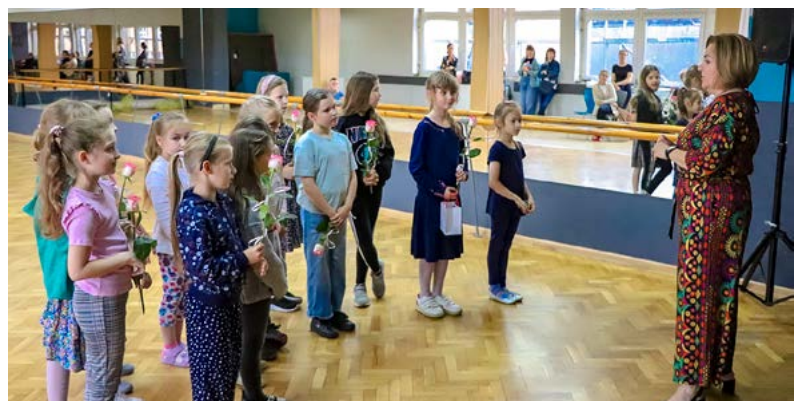
Posumowanie zajęć artystycznych.

Występami na Dniach Radzionkowa oficjalnie zakończyliśmy sezon artystyczny 2021/2022. Instruktorzy pożegnali się z uczestnikami zajęć na czas wakacji. Nie obyło się bez też wzruszenia, delikatnego smutku, ale i radości na nadchodzący odpoczynek. Aby uczcić rok ciężkiej pracy instruktorzy przygotowali dla swoich podopiecznych słodkie lodowe niespodzianki.