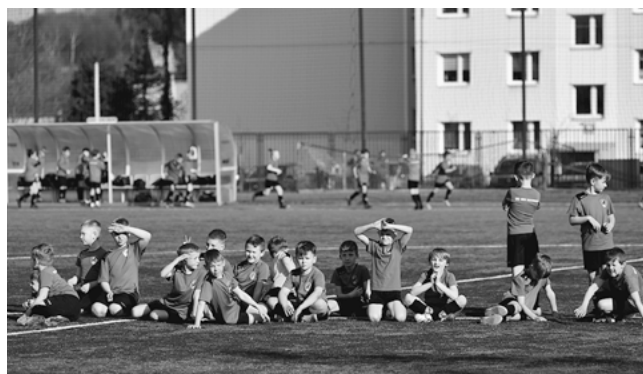
Przygotowania do sezonu.