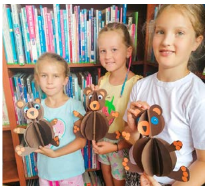
Warsztaty plastyczne w MBP.

Uczestnicy spotkali się między innymi z arachnologiem, florystą, ornitologiem, pszczelarzem, ogrodnikiem czy zielarzem. W podobnej tematyce, swoje warsztaty dla dzieci zorganizowała Miejska Biblioteka Publiczna. Podczas zajęć z cyklu „Zwierzęta świata”, mogły poznać zwyczajnie m.in. żyraf, pingwinów, papug czy żółwi. Filia Biblioteczna przy ul. Kuźaja 19 przeniosła zaś uczestników do świata baśni i fantasy dzięki „Akademii Papierowej Wyobraźni”. Najmłodszy, podczas warsztatów, wykonali piękne modele pirackich okrętów, smoków czy stworków.