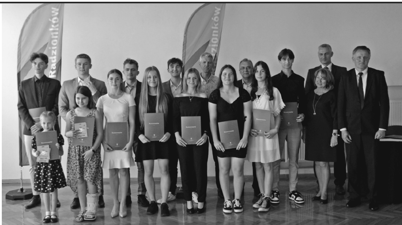
Laureaci tegorocznych nagród za wysokie wyniki sportowe.