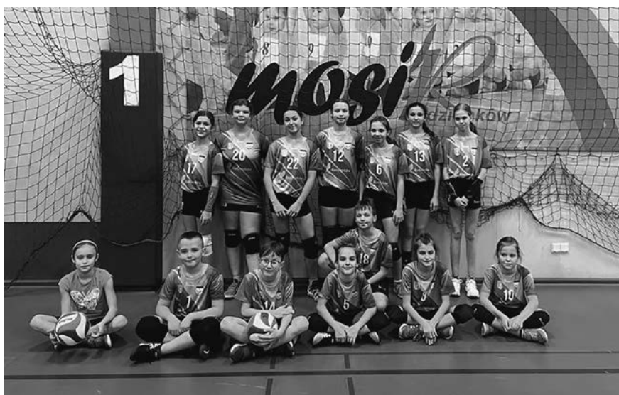
Najmłodszy reprezentanci klubu.