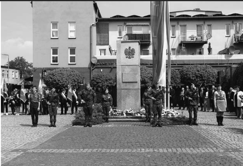
Uroczystości pod Pomnikiem Powstańców Śląskich.