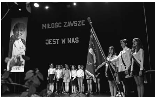
Montaż słowno-muzyczny przygotowali uczniowie szkoły.