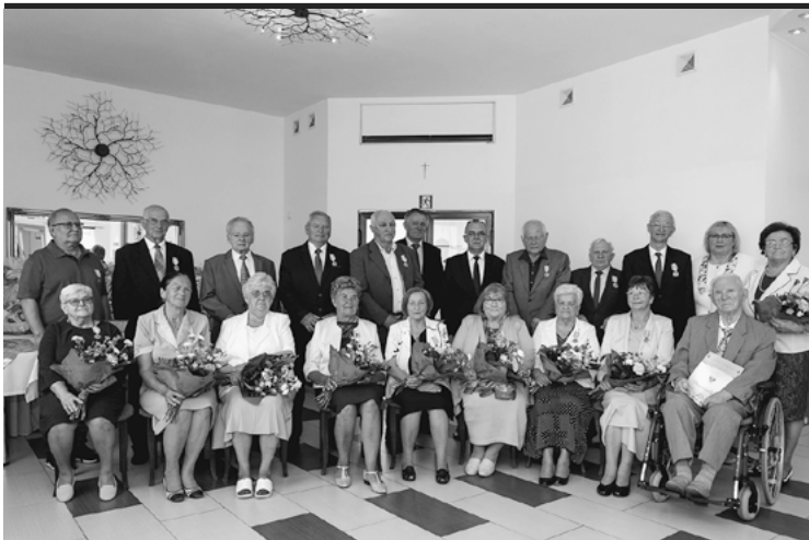
Jubilanci obchodzący 50- i 60-lecie małżeństwa.