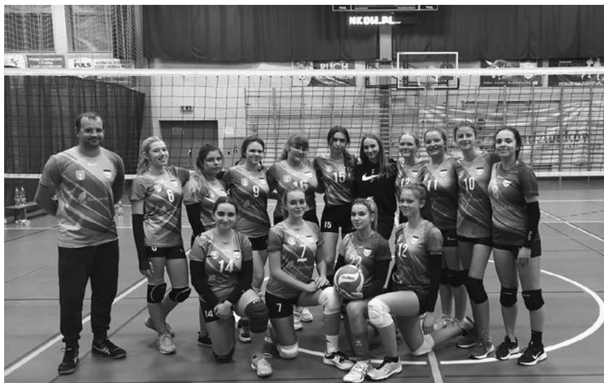
Młode siatkarki mają już na koncie wiele sportowych sukcesów.

Zapraszamy dzieci i młodzież do współpracy z MKS „Sokół” Radzionków. Wspólnie możemy budować nowe sukcesy siatkarskie w naszym mieście.