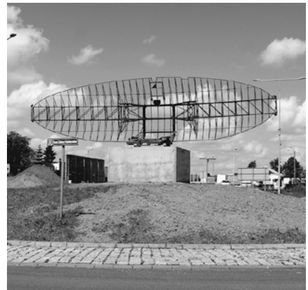
Antena radaru Nur-31 na rondzie.

W maju, na rondzie im. Żołnierzy Radiotechników w Radzionkowie stanęła antena radaru Nur-31. Inicjatywa ma upamiętnić działalność jednostki wojskowej w naszym mieście.