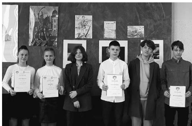
Laureaci gminnych konkursów z SP nr 4.