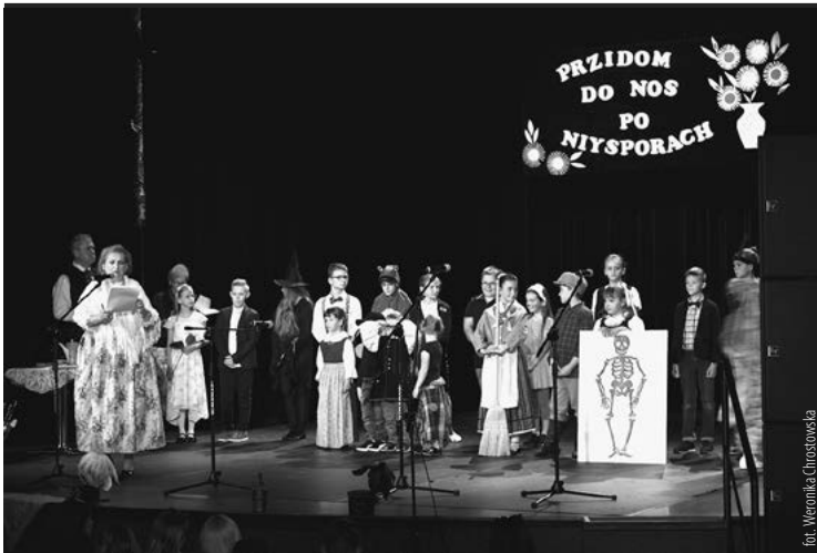
15 maja odbyła się Gala IX Parafialnego Łozprawiania „Przidom do nos po niysporach”.