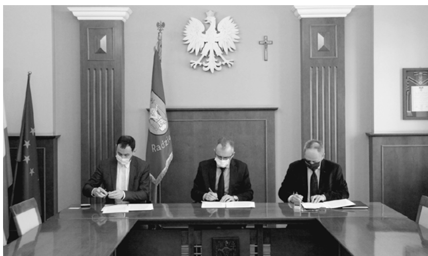
Podpisanie umowy na budowę basenu.