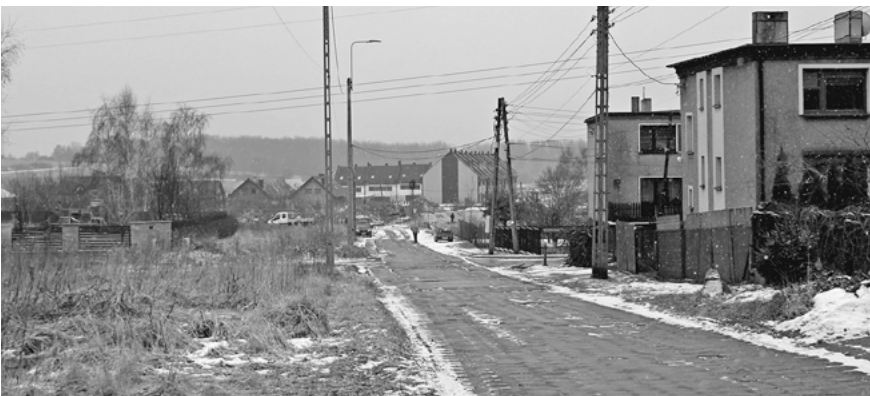
Ul. M. Dąbrowskiej przed przebudową.

W grudniu zakończyła się budowa zbiornika retencyjnego. Powstało ogrodzenie, jazd i separator na potrzeby odprowadzenia wód deszczowych.