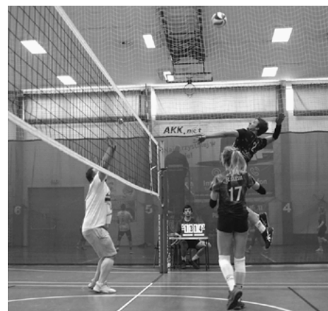
Zacięta rywalizacja przy siatce.

Udanie, sezon 2021 w Radzionkowie zakończyli siatkarze. 4 grudnia odbył się bowiem Świąteczny Turniej Mikstów, podczas którego nie brakowało emocji.