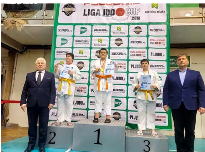
Pamiętkowe zdjęcie medalistów.