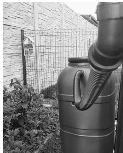
Przykłady rozwiązań na „łapanie deszczówki” udostępnione przez naszych mieszkańców.