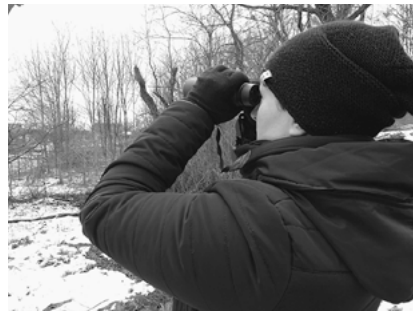
Uczestnicy wypatrywali ptaków przy pomocy lornetek

opracowań wykonywanych przez profesjonalnych ornitologów. Obserwacje takie umożliwiają także zauważenie ciekawych zjawisk zachodzących w ptasim świecie.