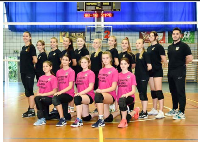
Drużyna kadetek z Radzionkowa.

15 grudnia 2021 r. dziewczyny awansowały do 1/8 Mistrzostw Śląska, by po bardzo dobrych spotkaniach i z uśmiechem na ustach awansować do ćwierćfinałów Mistrzostw Śląska. Nasze siatkarki w styczniowych zmaganiach dały z siebie wszystko i zacięcie walczyły w każdym pojedynku na hali w Dąbrowie Górniczej. Choć nie udało się zająć czołowych lokat, dziewczyny nadal walczyły o miejsca 9-12, co dla dopiero raczkującej w rozgrywkach dru-