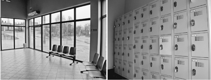
Centrum Przesiadkowe w Radzionkowie.

Od połowy stycznia mieszkańcy mogą korzystać z nowego Centrum Przesiadkowego, które powstało przy Dworcu PKP Rojca w Radzionkowie.