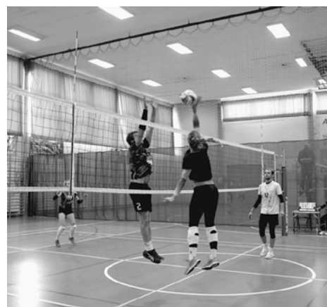
W turnieju rywalizowało dziewięć drużyn.